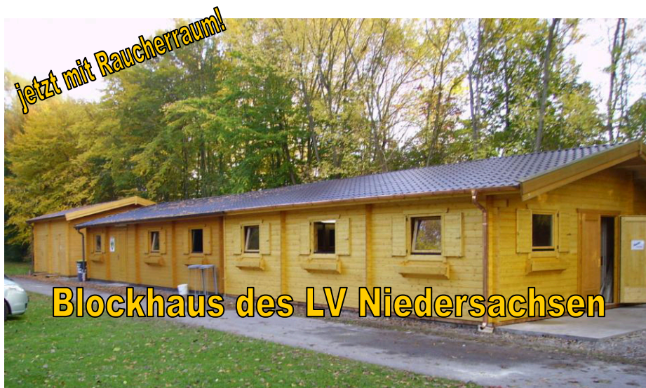
Blockhaus des LV Niedersachsen

DCC- KUR- Campingpark Bad Gandersheim DCC- Campingführer Nummer 2830